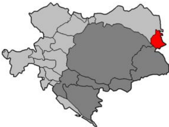
Poziția localității Bucovina